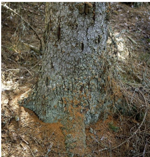
Mizgraužu svaigi invadēts koks