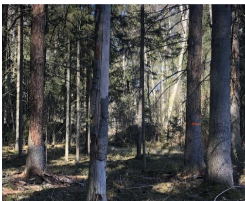
Mizgraužu nodarītie postījumi mežā