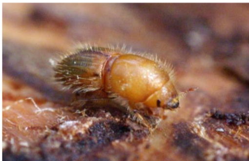
Ips typographus

Lūdzu ievērot piesardzību, redzot darba drošības zīmes, un netuvoties tehnikai mežizstrādes darbu laikā!