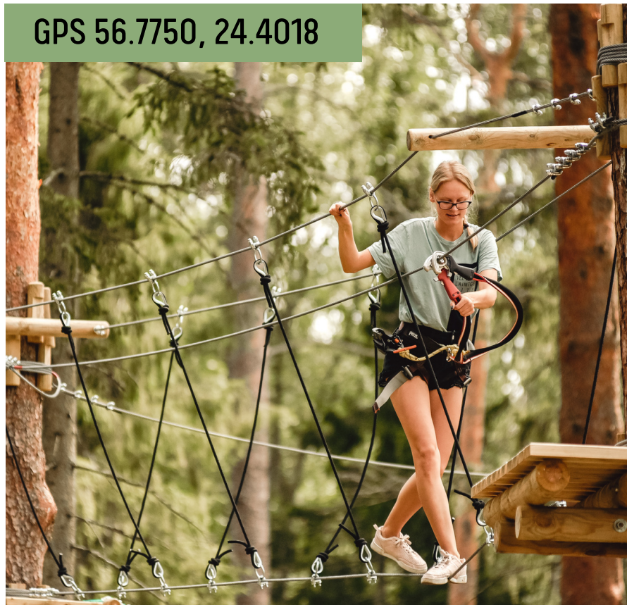
Aktīvās atpūtas komplekss "Riekstukalns"