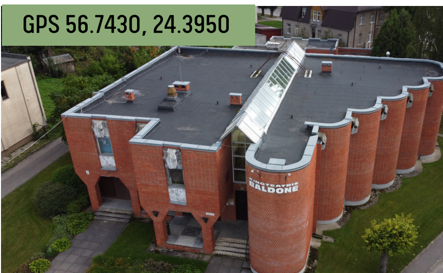
Kultūras centrs / Baldones kultūra