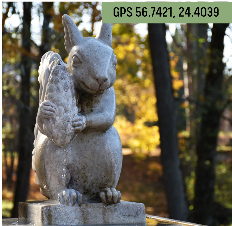
Aktīvās atpūtas komplekss "Riekstukalns"