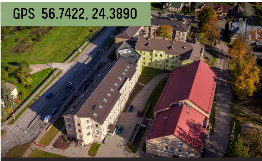
Sākums / Sports Baldonē