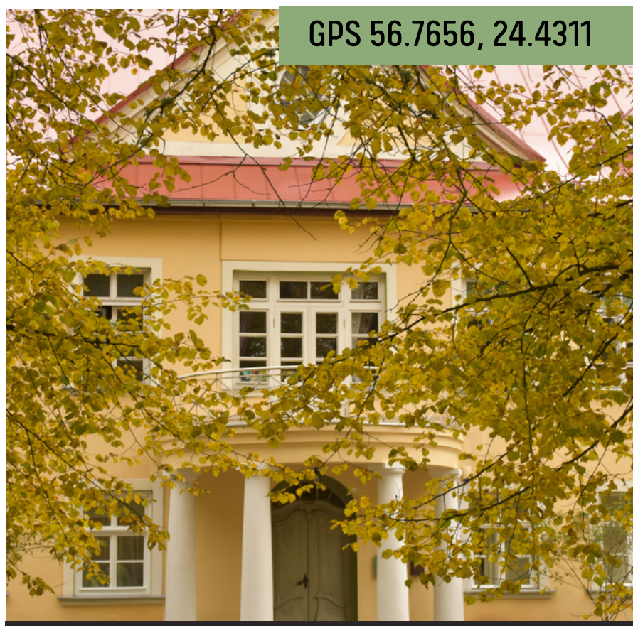
Mercendarbes muiža / Baldones muzejs