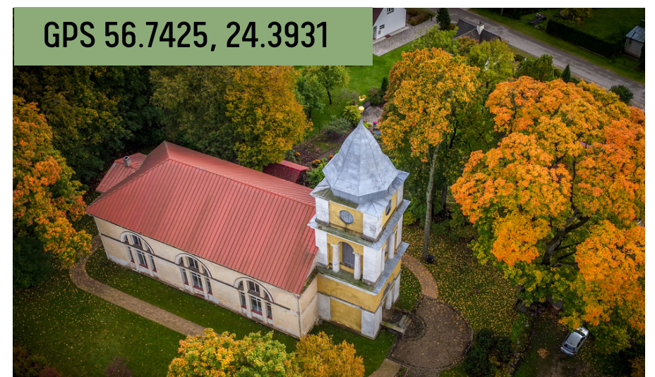
Baldones Sv. Miķeļa baznīca