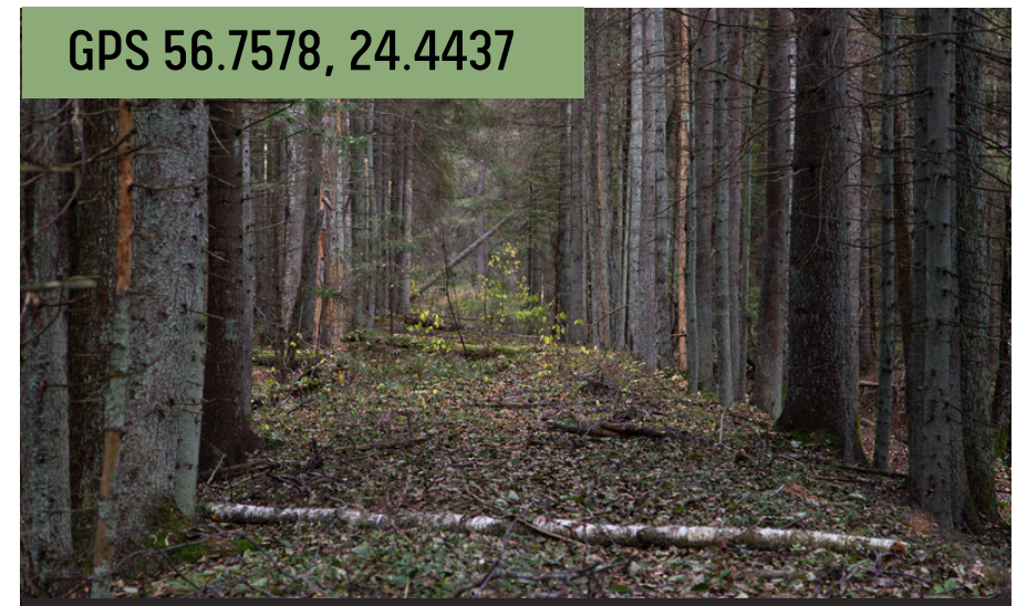
Pirmā pasaules kara dzelzsceļa uzbērums